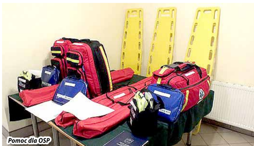
Pomoc dla OSP