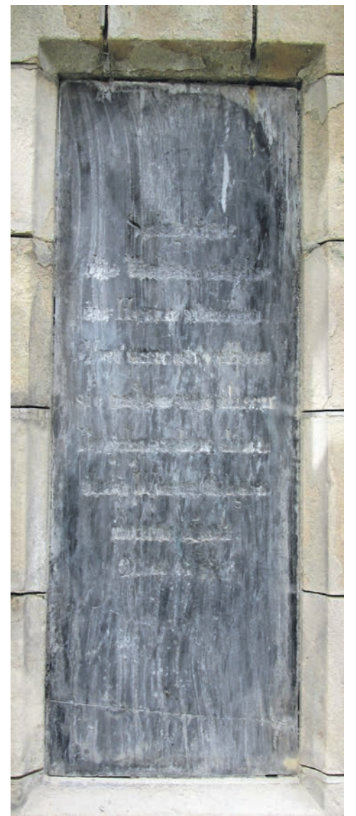
Tablice z mauzoleum: lewa (prawie kompletnie zniszczona) i prawa. Na obu napisy skuto po 1945 roku