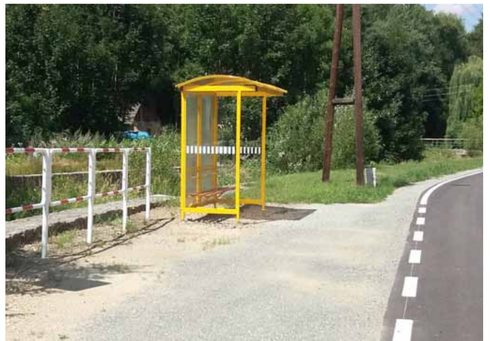
Nowa wiata przystankowa w Mąkolnie