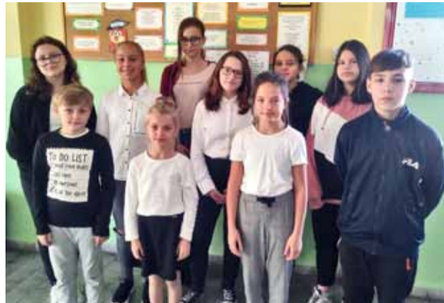
Skład Rady Samorządu Uczniowskiego